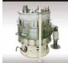
インラインマグネット